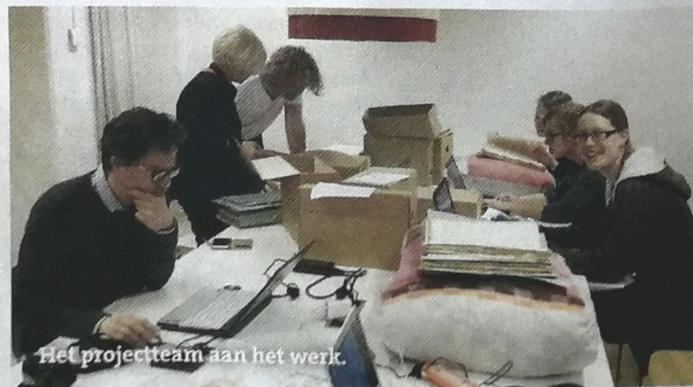
Het projectteam aan het werk.

gebruikt. Net als Six was Cornelis een ijdeltuit en dat heb ik in deze tekening proberen te vangen.' Nadat de vorm van de bundel was vastgesteld, moest er nagedacht worden over welke brieven erin werden opgenomen. Alle vrijwilligers hebben daarvoor