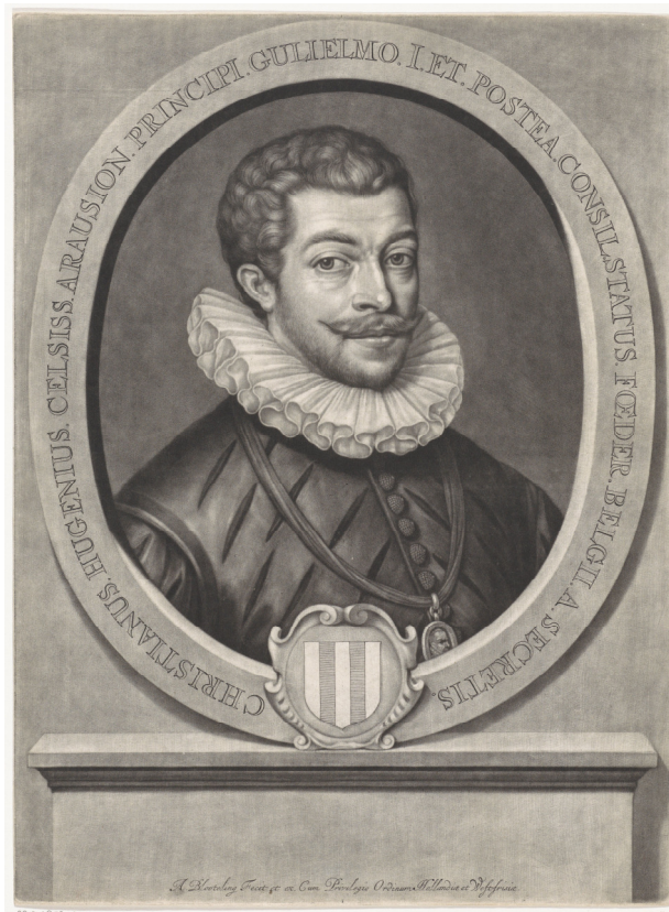
Portret van Christiaan Huygens sr. uit 1655-1690 (enkele decennia na zijn overlijden), door Abraham Bloteling, Rijksmuseum.