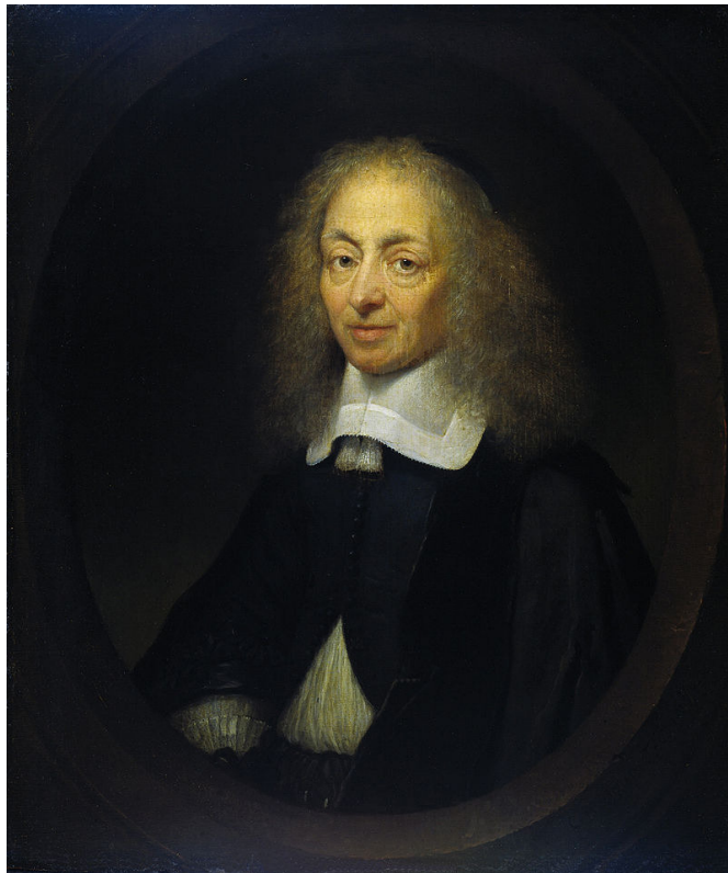
Portret van Constantijn uit 1672 (hij is dan 76), door Caspar Netscher; Rijksmuseum Amsterdam.

Van de Nederlandse dichter en diplomaat Constantijn Huygens sr. (1596-1687) zijn een groot aantal brieven overgeleverd, waarvan er sinds 2010 zo'n 8922 online beschikbaar zijn in de database 'Briefwisseling van Constantijn Huygens 1607-1687' van het Huygens ING. In deze serie blogs worden er brieven uitgelicht die Constantijn in zijn jonge jaren uitwisselde met zijn ouders en zussen, en die een persoonlijkere kant van hem laten zien.