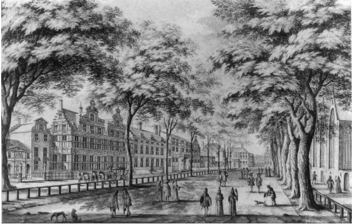
Het Lange Voorhout in Den Haag rond 1689