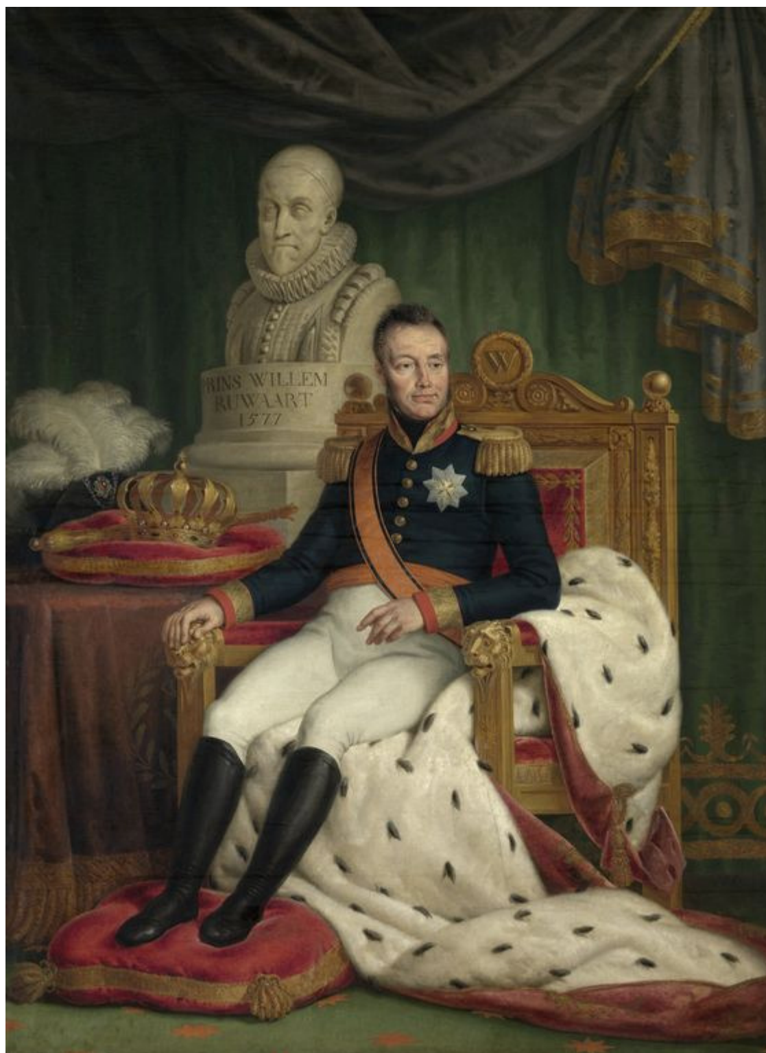
Willem I – Mathieu Ignace van Bree