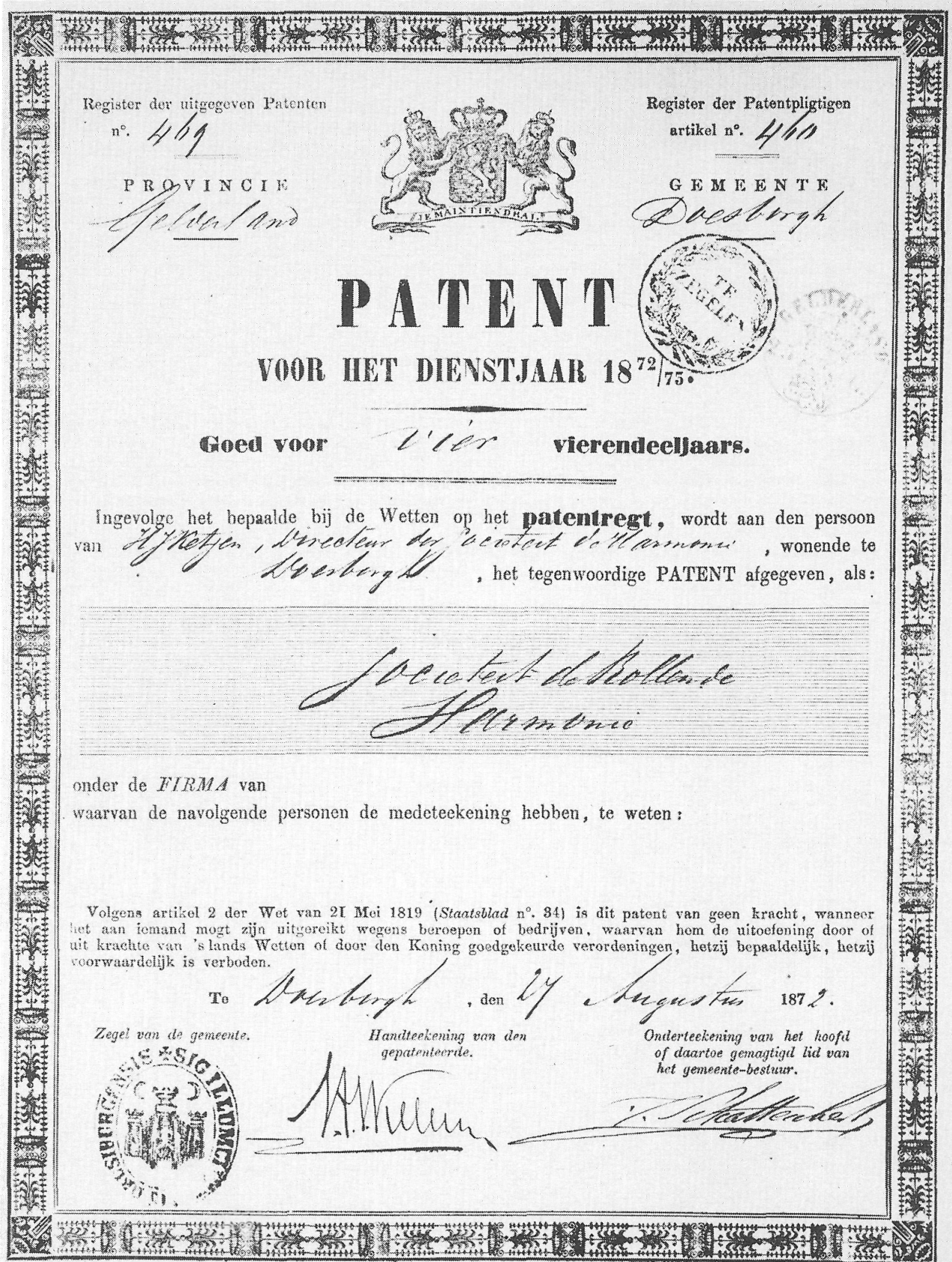
Afbeelding 4: Een Patent.